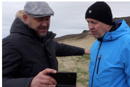
Gæta verður að fornminjum neðanjarðar