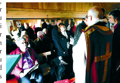
Síðasta messan í Krýsuvíkurkirkju 11. okt. 2009

Gestabækur kirkjunnar, sem varðveist hafa, geyma umsagnir og þakkarorð á fjölda tungumála. Í upprunalegri mynd og látleysi sínu í máttugu umhverfi mun Krýsuvíkurkirkja sem fyrr laða fjölmarga til sín og vekja þá auðmýkt í sálu er nemur návist Guðs í sköpunarundrum. Og inni í helgidóminum mun altarisstaflan Upprisa, óhlutbundin og litsterk, tengja sögu og samtíð og boða endursköpun lífs í Jesú nafni. Og það mun Krýsuvíkurkirkja gera upprisin og endurreist.