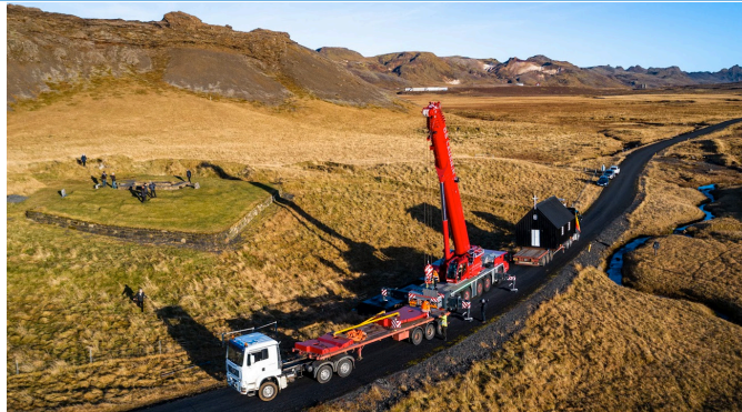
Kraninn gerður balansklár til að geta lýft 8 tonna kirkjunni yfir á grunn sinn í um 25 metra fjarlægð