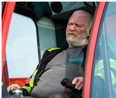
Þar var kranamaðurinn fremstur í flokki, rólegur og yfirvegaður