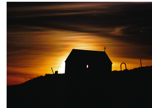
Krýsuvíkurkirkja árið 2005.