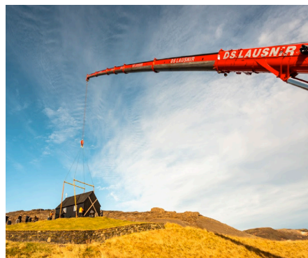
Fyrirtækið DS LAUSNIR lagði til tæki og mannskap án endurgjalds