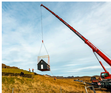
Margir komu til að fylgjast með fúmlausum hífingarmönnum