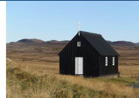
Krýsuvíkurkirkja daginn sem hún var hífð á grunn sinn þann 10. október 2020.

líkast því sem lífið endurriti leiftrandi von á dauðans minnisblað.