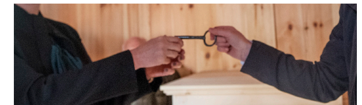
Tækniskólinn afhentir Þjóðminjasafninu lykil Krýsuvíkurkirkju

Takk öll og til hamingju, þetta er stórkostlegt. Og skilið kveðju til nemenda skólans með innilegum þökkum frá okkur á Þjóðminjasafninu og í þjóðminjavörslunni.