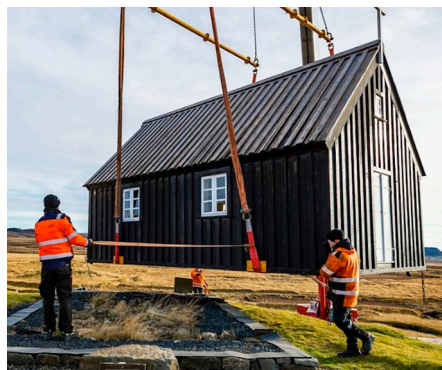
Og nú reyndi á stærðar- og hallamál kirkjuginnsins