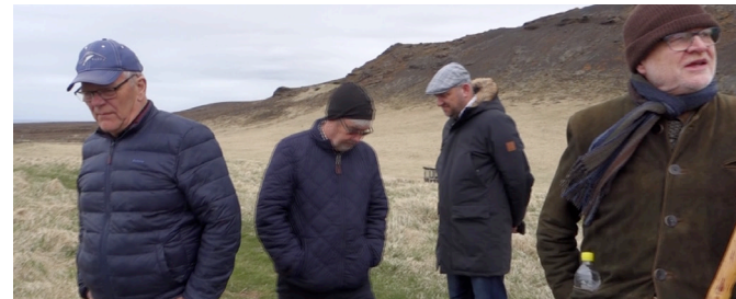
Vettvangsmenn í þungum þönkum

Vettvangsferðinni lauk á því að nokkrir úr hópnum komu við í Sveinssafni til að ræða ýmis framkvæmdatriði áður en haldið var aftur til Hafnarfjarðar. Fimm mánuðir liðu svo fram að flutningi.