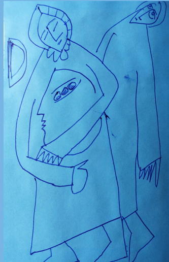
Sýningin KONAN MÍN: Myndgerving trúarinnar eftir Svein Björnsson