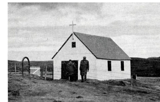
Krýsuvíkurkirkja árið 1964. Sáluhlíð að norðanverðu og girðing umhverfis kirkjuna. Hverjir eru á myndinni?