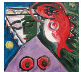
Sýningin KONAN MÍN í Sveinshúsi