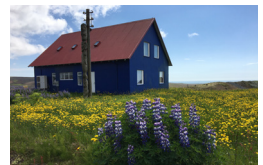
Sveinshús gegnt Grænavatni og súrheysturnum