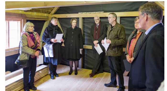
Biskup skoðar Krýsuvíkurkirkju í smíðum í vísitasíu sinni