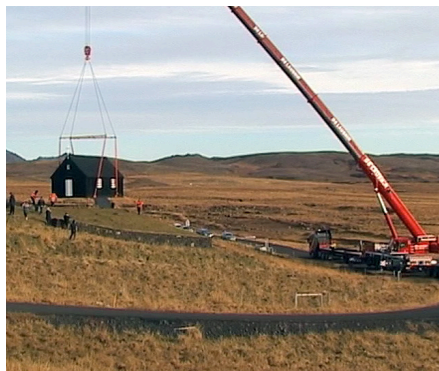
Ögleymanleg stund fyrir alla nærstadda