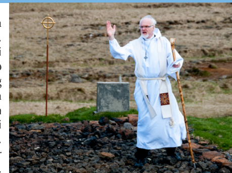
Trúin á upprisu Krýsuvíkurkirkju 2011