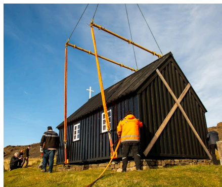
Sömu sögu er að segja um alla aðra sem komu að flutningnum